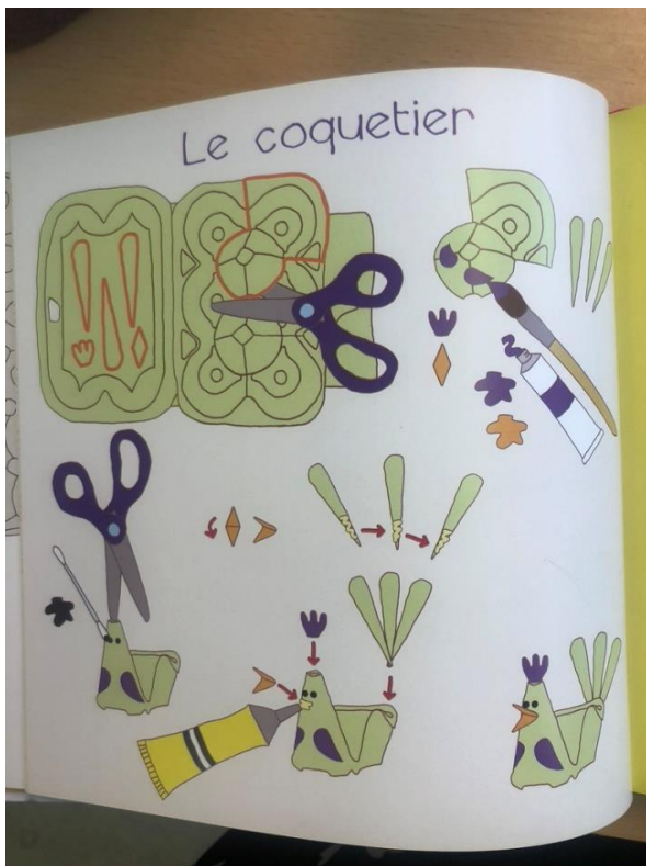
Schéma de découpe