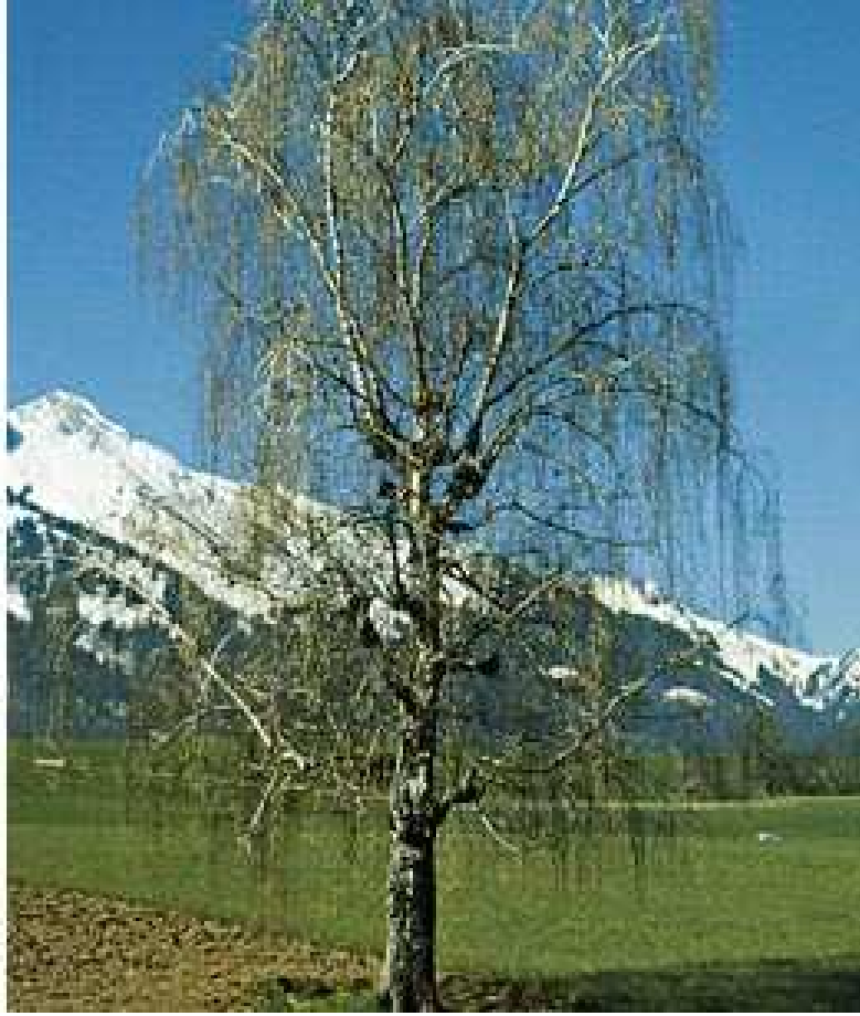
Le bouleau a l'écorce blanche