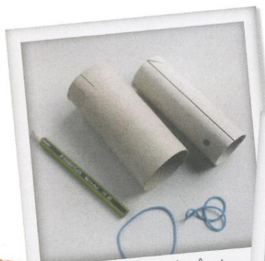
Le matériel : un tube fendu et percé, un autre entaillé, deux élastiques et un crayon.

6 On peut aussi s'amuser à décorer son canon, et fabriquer une cible, par exemple un carton vertical percé de trous (voir p. 22).