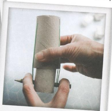
La position pour tirer : une main tient le grand tube, l'autre tire le crayon.